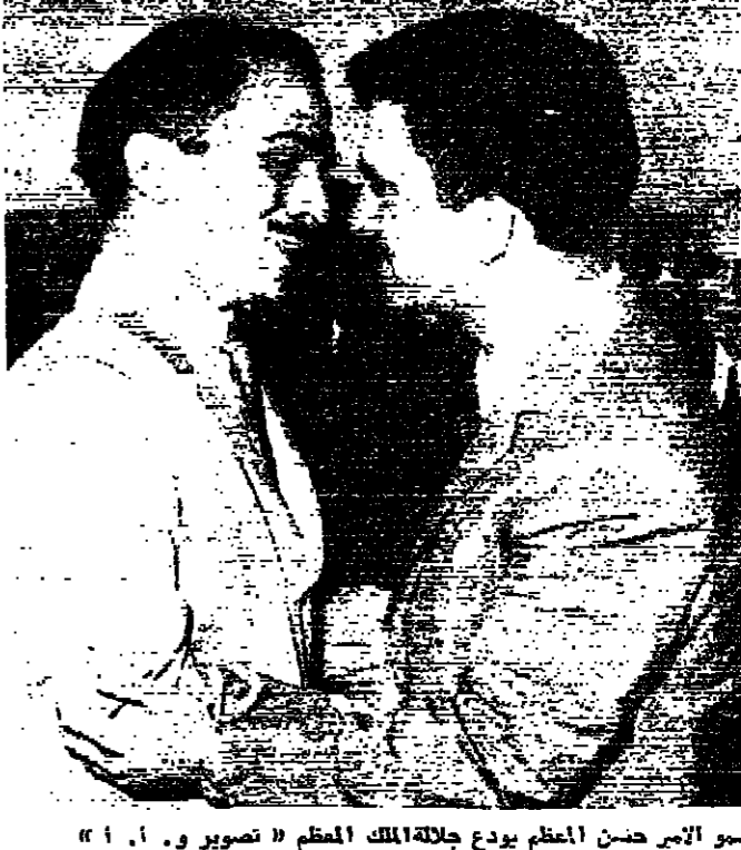
سمو الامير حسن العظم يودع جلالة الملك العظم

محادثات جلالة الحسين مع الرئيس عبد الناصر اذاع راديو القاهرة ان جلالة الملك الحسين العظم سيصل الى القاهرة بعد ظهر اليوم في زيارة قصيرة لجمهورية العربية المتحدة يجري خلالها محادثات مع الرئيس جمال عبد الناصر من نظرات الوضع في ازمة الشرق الاوسط . ومن المقرر ان يقضي جلالة الملك واحدة في القاهرة على ان يغادرها الساعة التاسعة من صباح غد « الثلاثاء » في طريقه الى ليبيا . سمو ولي العهد نائب جلالة الملك عمان - صدرت الاذاعة المكتوبة السابعة بتعيين سمو الامير حسن ولي العهد العظم نائباً لجلالة الملك العظم طيلة غياب جلالة عن ارض الوطن . وقد ادى سموه التحين الدستوري بين يدي جلالة بحضور دولة رئيس الوزراء وسيدادة رئيس الديوان الملكي الهاشمي وهنئة الوزارة .